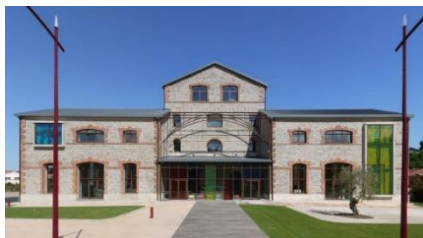
Médiathèque de FOLELLI

FOLELLI se situe dans la commune de PENTA DI CASINCA à 30 kms au sud de BASTIA, le long du littoral.