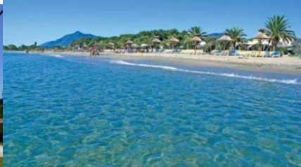
Plage du San Pellegrino