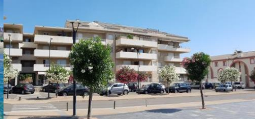
Centre-ville de FOLELLI